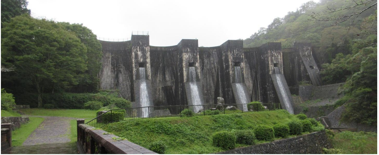
・旧中樋取水バルブ

…マルチプルアーチ式ダム：大正 15 年～昭和 4 年，高さ 100 尺-30m，延長 480 尺-144m